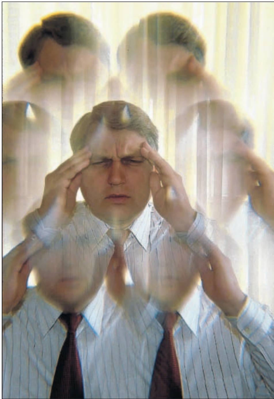
„Ich glaube, ich schaffe das nicht“: Stress bei der Arbeit ist weit verbreitet.